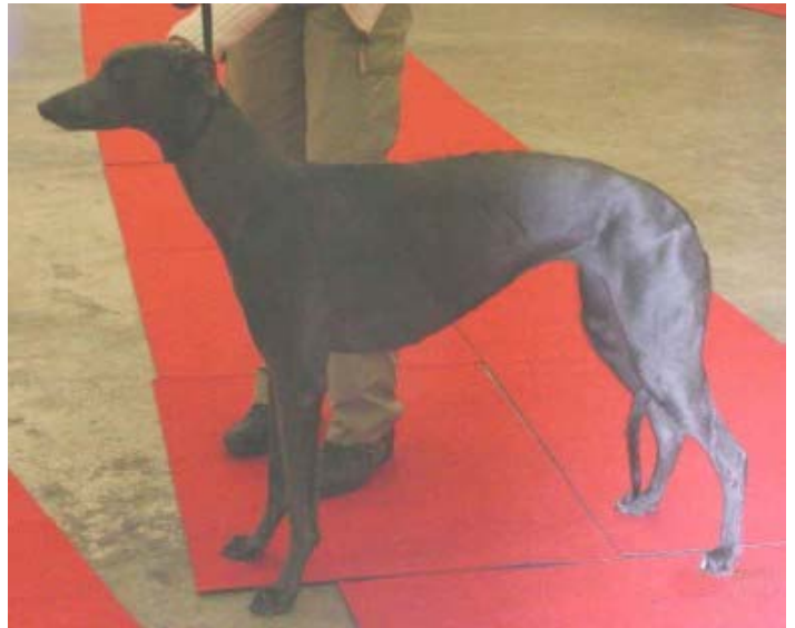
Kalahari Blue of Resin Farm