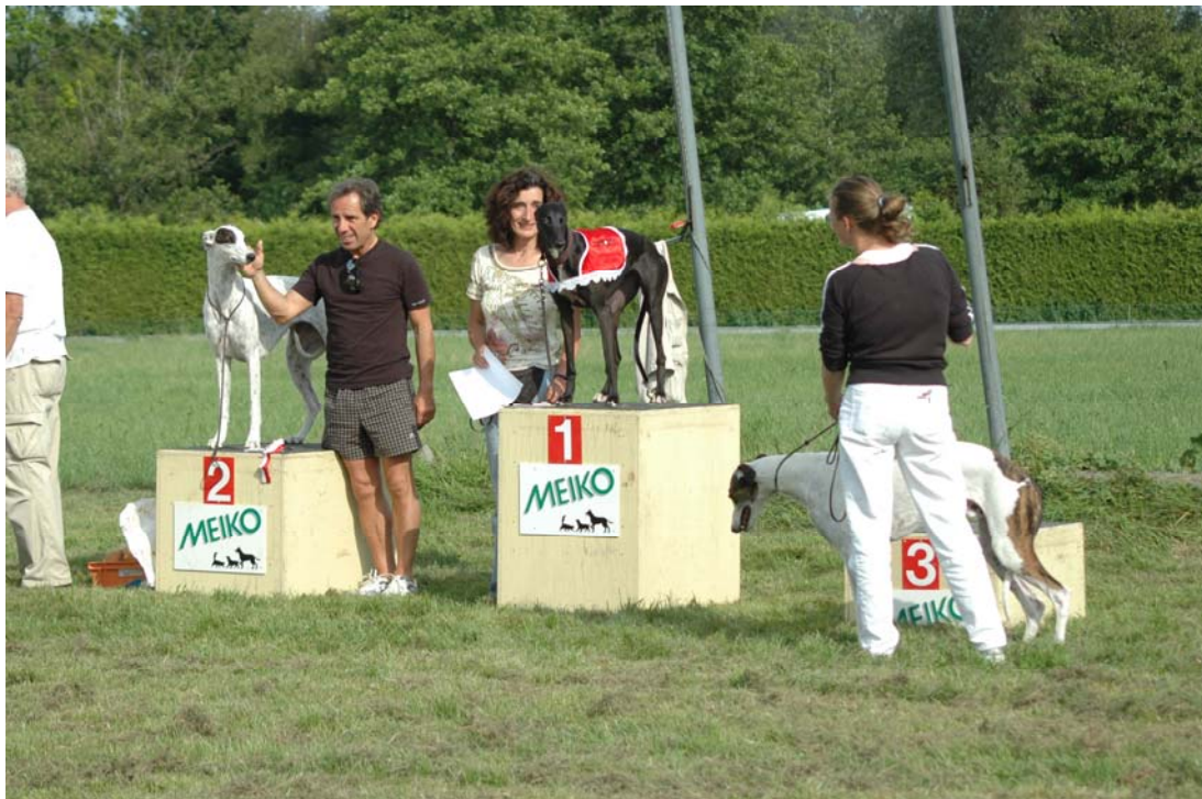
Greyhounds: 1. Rosalie of Goldenqueen (T. Gualeni); 2. Paloma Picasso Karkati's; 3. Pablo Picasso Karkati's (R. Posa)