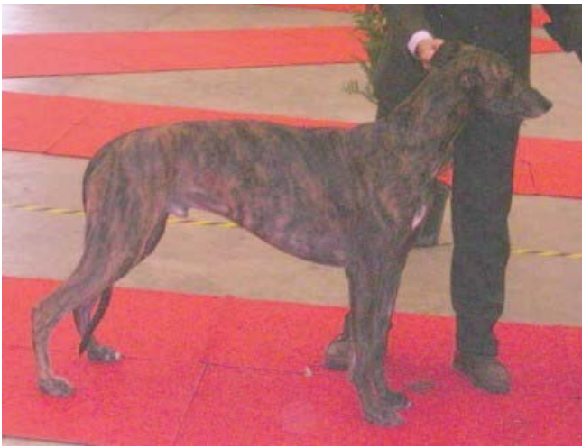
Fionn Clann Jagger Ailin