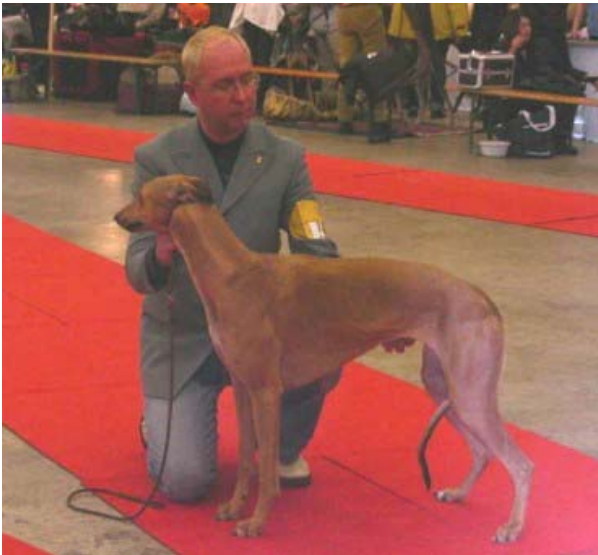
Pearl of Goldenqueen

Pearl of Goldenqueen SHSB 632709 Gertrud Zürcher, Trey 2½ Jahre; elegante Hündin; korrekter Kopf; etwas spitz zusammenl. Fang; korrekte obere und untere Linie; korrekte Winkelungen; korrekte Schere; korrekt bemuskelt; zeigt sich sehr unsicher im Ring; korrekte Bewegung vorzüglich 1 CAC